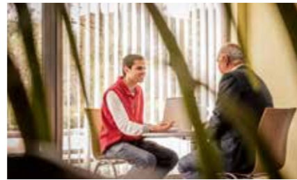
... ou des conseils sociaux.