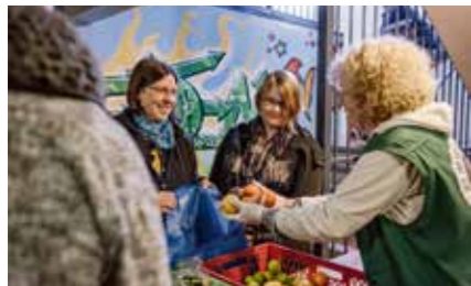
« L'activité centrale » : la distribution de denrées alimentaires.

Les établissements Tafel locaux travaillent selon différents modèles. Certains établissements fournissent exclusivement des denrées alimentaires, d'autres distribuent des repas chauds, d'autres encore offrent une aide vestimentaire ou des conseils sociaux. Beaucoup proposent également des cours de cuisine pour enfants, des cours d'allemand ou des cafés pour seniors. Ils deviennent ainsi des lieux sociaux de rencontre pour des personnes de différentes origines, éducations et de différents âges. Les offres de Tafel sont aussi variées que ses clientes et clients, et sont toutes réunies sous le toit de Tafel Deutschland.