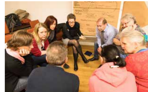
Les membres de Tafel travaillent en réseau et apprennent grâce aux expériences d'autres établissements Tafel.