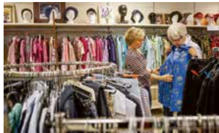
Certains offrent également une aide vestimentaire ...