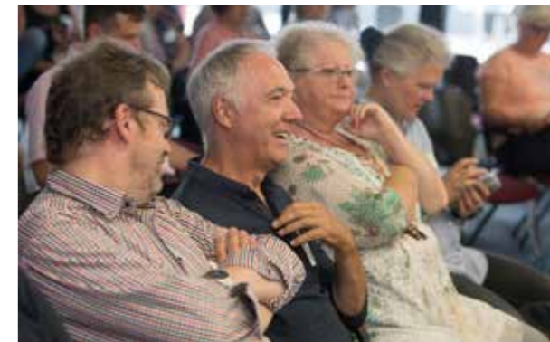
L'Académie Tafel transmet des connaissances autour des actions caritatives aux membres de Tafel dans toute l'Allemagne, qu'il s'agisse de la sécurité alimentaire et professionnelle, de la collecte de fonds ou des relations publiques.

→ Pour plus d'informations sur l'Académie Tafel et sur les cours, rendez-vous sur : www.tafel-akademie.de