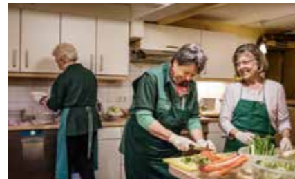
D'autres établissements Tafel cuisinent les aliments et distribuent des repas chauds.