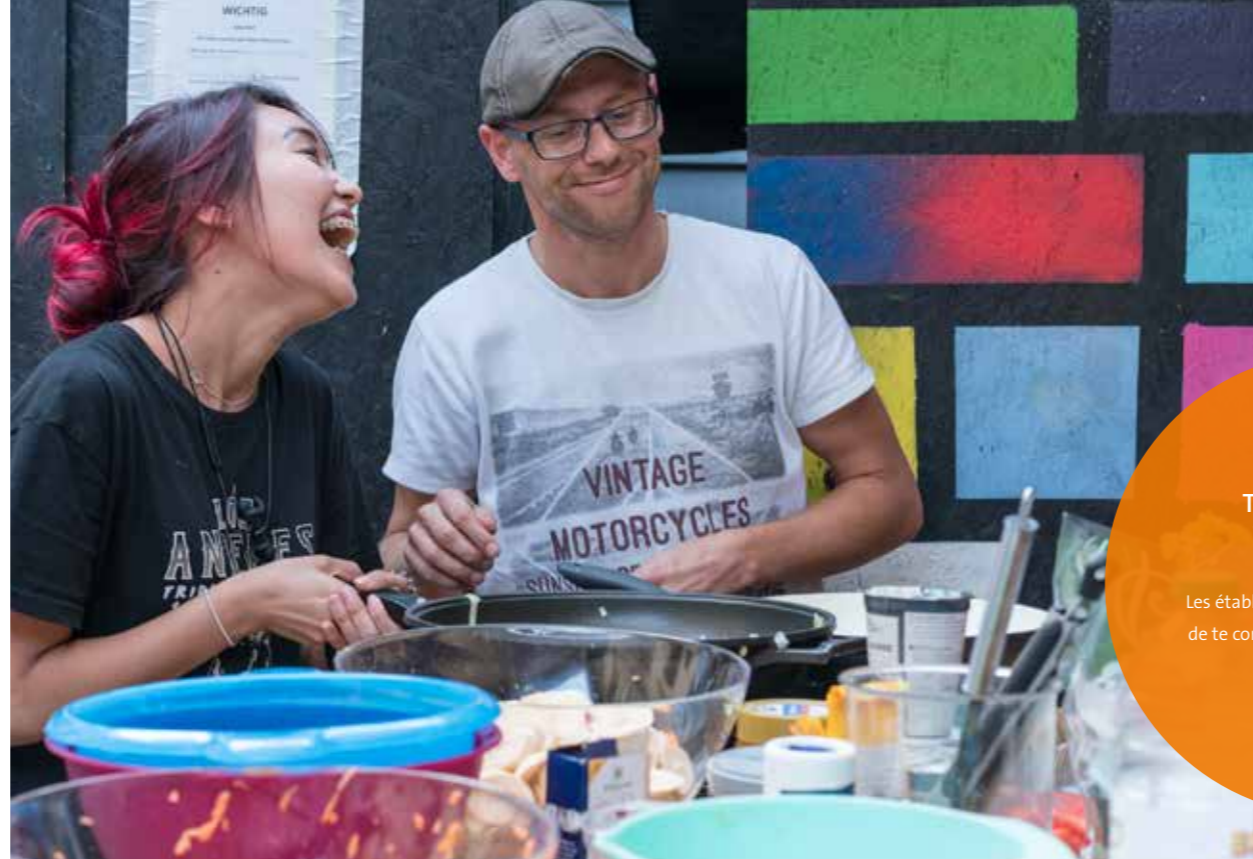
L'objectif des jeunes volontaires de Tafel : faire bouger plus de choses, sans oublier de s'amuser.

Tu souhaites être actif, ou tu es déjà engagé mais tu ne fais pas encore partie de Tafel Jugend ? Alors envoie un e-mail à info@tafel-jugend.de ! Tafel Jugend se réjouit de toutes les formes de soutien !